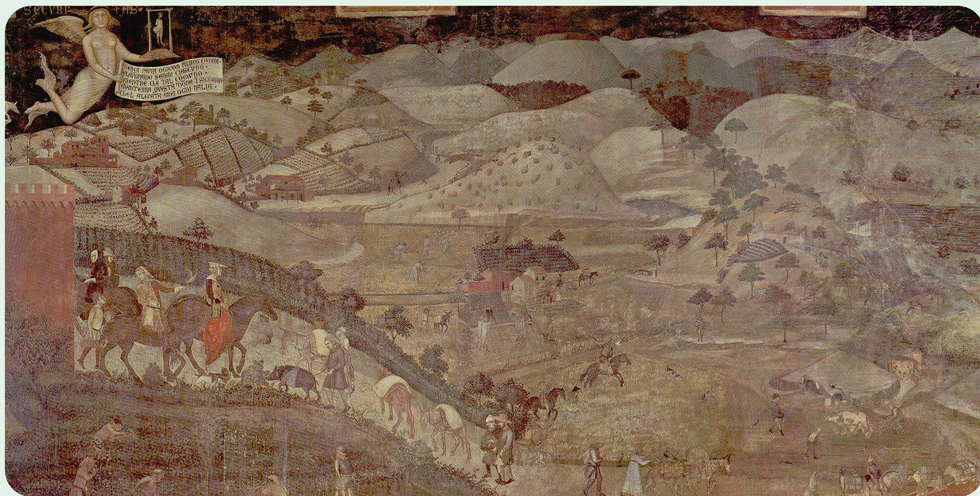
EFFETTI DEL BUON GOVERNO IN CAMPAGNA 1338-1339 | Sala della Pace | Palazzo Pubblico | Siena

STRATEGIE E POLITICHE SOSTENIBILI PER LA MONTAGNA MERIDIONALE