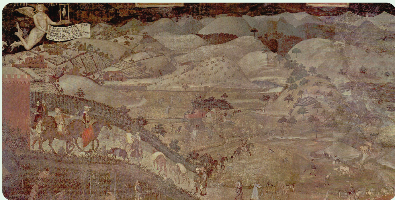
EFFETTI DEL BUON GOVERNO IN CAMPAGNA 1338-1339 | Sala della Pace | Palazzo Pubblico | Siena

Comuni e comunità in dialogo. Montagna alla prova del domani